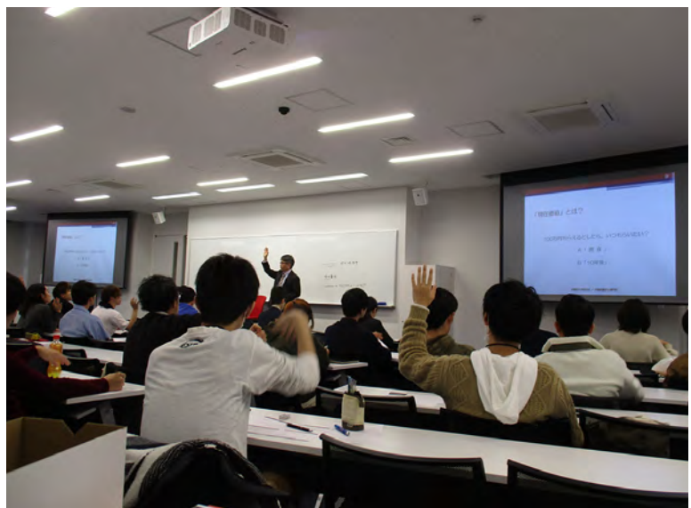
早稲田大学での講義の様子

全学部の学生が受講可能で、当初から100人を超える申し込みがあり、出席者は100人強です。講師は稲門