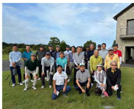
鮎滝カントリークラブ

（鮎滝カントリークラブ）」が開催されました。晴天にも恵まれいずれも大盛況であったようです。ご参加頂いた会員の皆様及びご協力いただきました四国会の皆様、大変ありがとうございました。