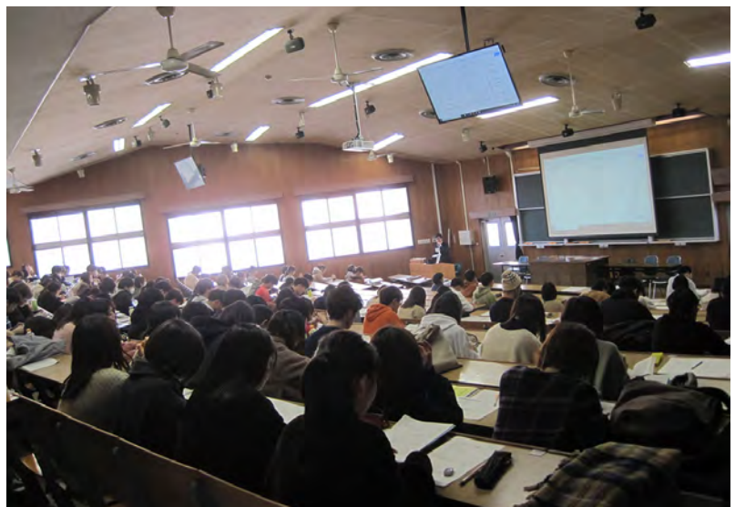
熊本大学での講義の様子

専門八士業 * の枠組みで2019年からスタートし、熊本大学法学部の2～4年生を対象に、100人程度の学生が履修しています。八士業で全16コマをリレー講義で行い、1士業につき2コマという時間的制約のため、職業ガイダンスに終始している印象です。講師は八士業を担当する広報委員会を中心に、90分の講義につき1万5千円の謝礼が出ています。